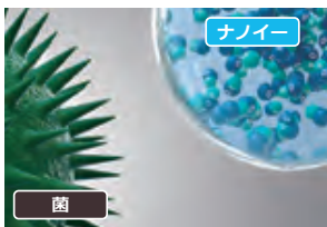
ナノイー が的確に菌に届く。