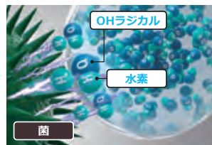
OHラジカルが菌のタンパク質を変性。